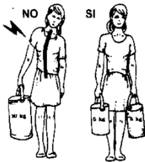
BILANCIARE SEMPRE I CARICHI